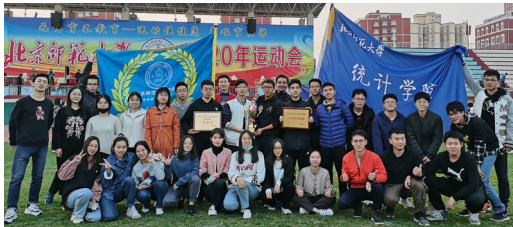
学生活动 - 2020 年运动会

学院教师主持国家级科研项目 60 余项，包括国家社科基金重大项目 9 项，重点项目 10 项，国家 973 项目 1 项，科技部重大专项 1 项。在国内外专业杂志发表论文 500 余篇。获奖励 20 余项。高水平科研及项目成果为学院扎实推进专业人才培养提供了坚实支撑。